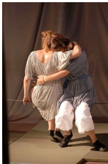
N° 6 : le grand succès du professeur : une création double