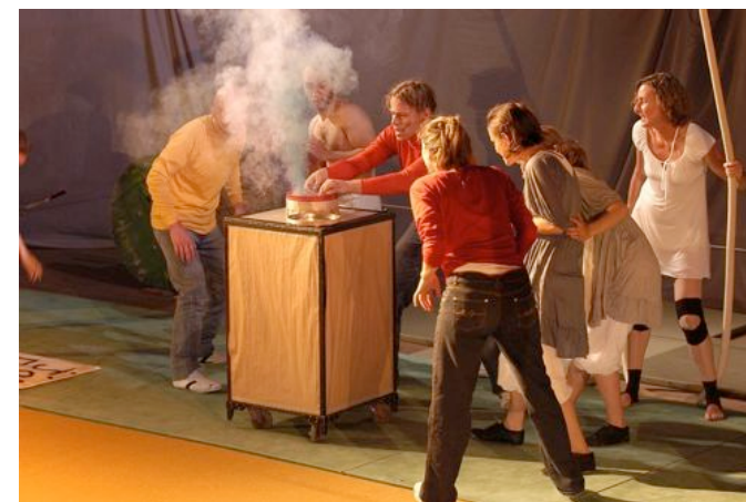
Triste fin pour le professeur P.