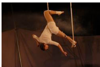
N°5 : ne peut pas toucher le sol