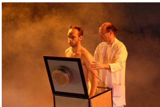
Création de N°7