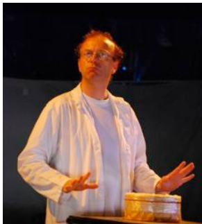
Le professeur P

Dans son laboratoire, le Professeur P. se livre à des expériences bizarres et règne sur ses créations. Lorsqu'il crée N°7, un vent de folie va souffler sur le labo et il aura bien du mal à maîtriser ses créatures.